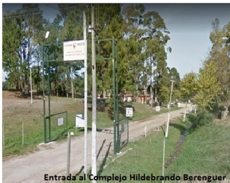
Entrada al Complejo Hildebrando Berenguer

Seguimos trabajando denodadamente para darles a nuestros futuros visitantes la mejor atención, en el que será nuestro segundo Encuentro en nuestro país.