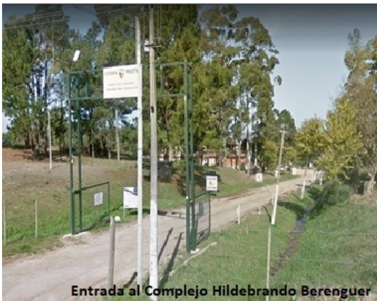
Entrada al Complejo Hildebrando Berenguer

Nous continuons à travailler très dur pour donner la meilleure attention à nos futurs visiteurs, dans ce qui sera notre deuxième Rencontre dans notre pays.